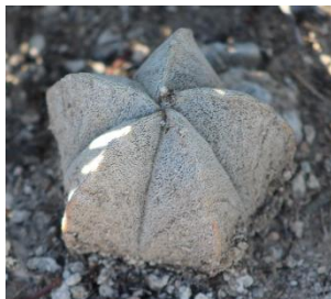
Bonete Coahuilense ( Astrophytum coahuilense )

La vegetación que encontramos en la reserva son los matorrales que conviven con una amplia variedad de agaves como la Noa y el Maguey de Parras, así como cactáceas con alguna categoría de riesgo como el bonete de obispo, la biznaga de Coahuila y la biznaga de Durango; en combinación con estas especies encontramos otras como la candelilla y pastos.