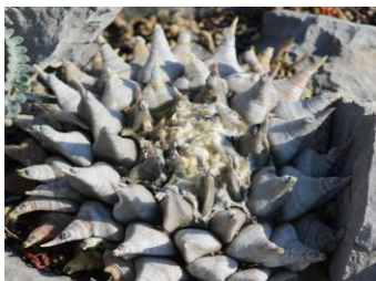
Chaute ( Ariocarpus retusus ssp. retusus )

En este reserva se hace un viaje desde el piso del valle en donde se encuentran pastizales y matorrales, pasando por sus laderas y cañones en donde se encuentran palmas más bien tropicales, hasta observar en las partes altas bosques de encinos y pinos. Tiene, además, una gran diversidad algunas de ellas protegidas por la norma mexicana.