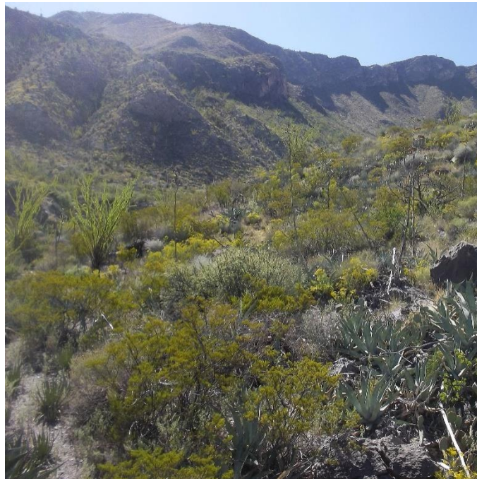
Diversidad de Vegetación