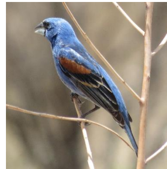
Picogordo Azul ( Passerina caerulea )

En el área protegida se pueden observar venados, zorras, coyotes y pumas, así como una gran cantidad de aves, desde rapaces como el halcón cola roja y búhos, hasta aves pequeñas como el chipe del Potosí. Los reptiles son también un grupo del que se encuentra una amplia diversidad de especies.