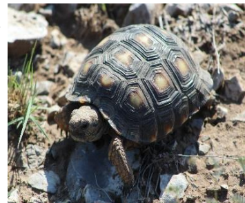
Tortuga del Desierto de Tamaulipas ( Gopherus berlandieri )

En el área protegida habitan venados, pumas, coyotes, osos negros y jabalíes, por mencionar solo algunas de las especies que se pueden encontrar. De la riqueza de reptiles destacan dos lagartijas y una víbora endémicas de la región. La mariposa Monarca se alimenta y descansa en la Reserva durante su migración.