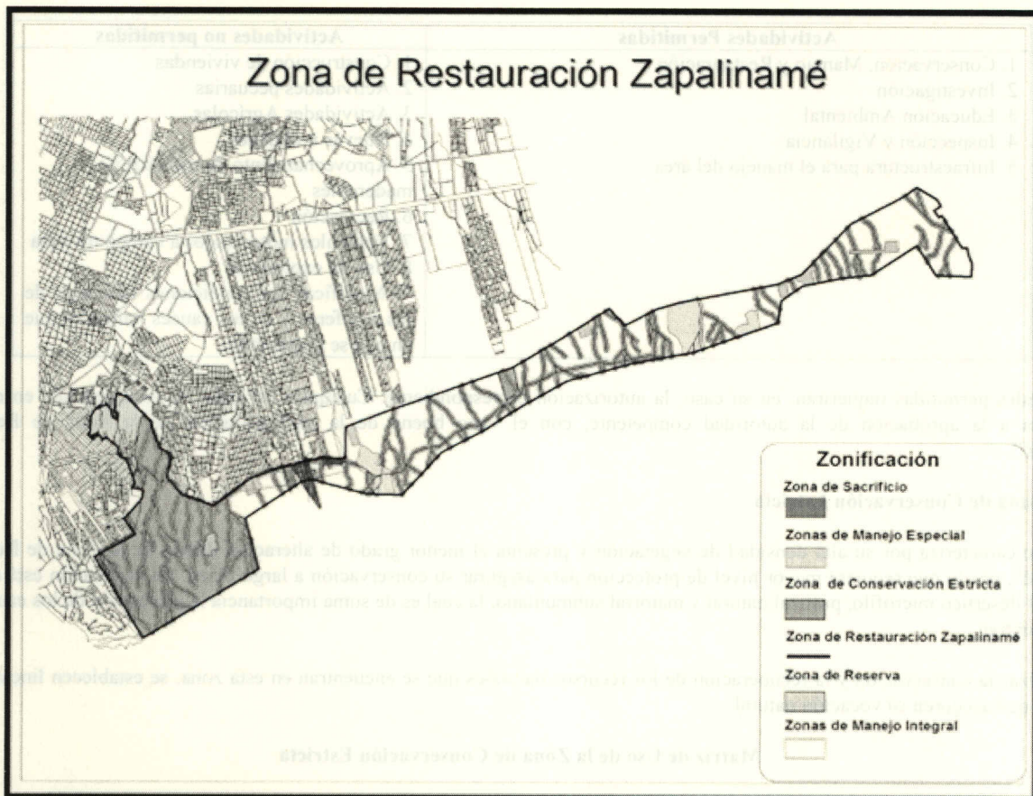
Figura No. 2. Mapa de Zonificación de la Zona de Restauración Zapalinamé