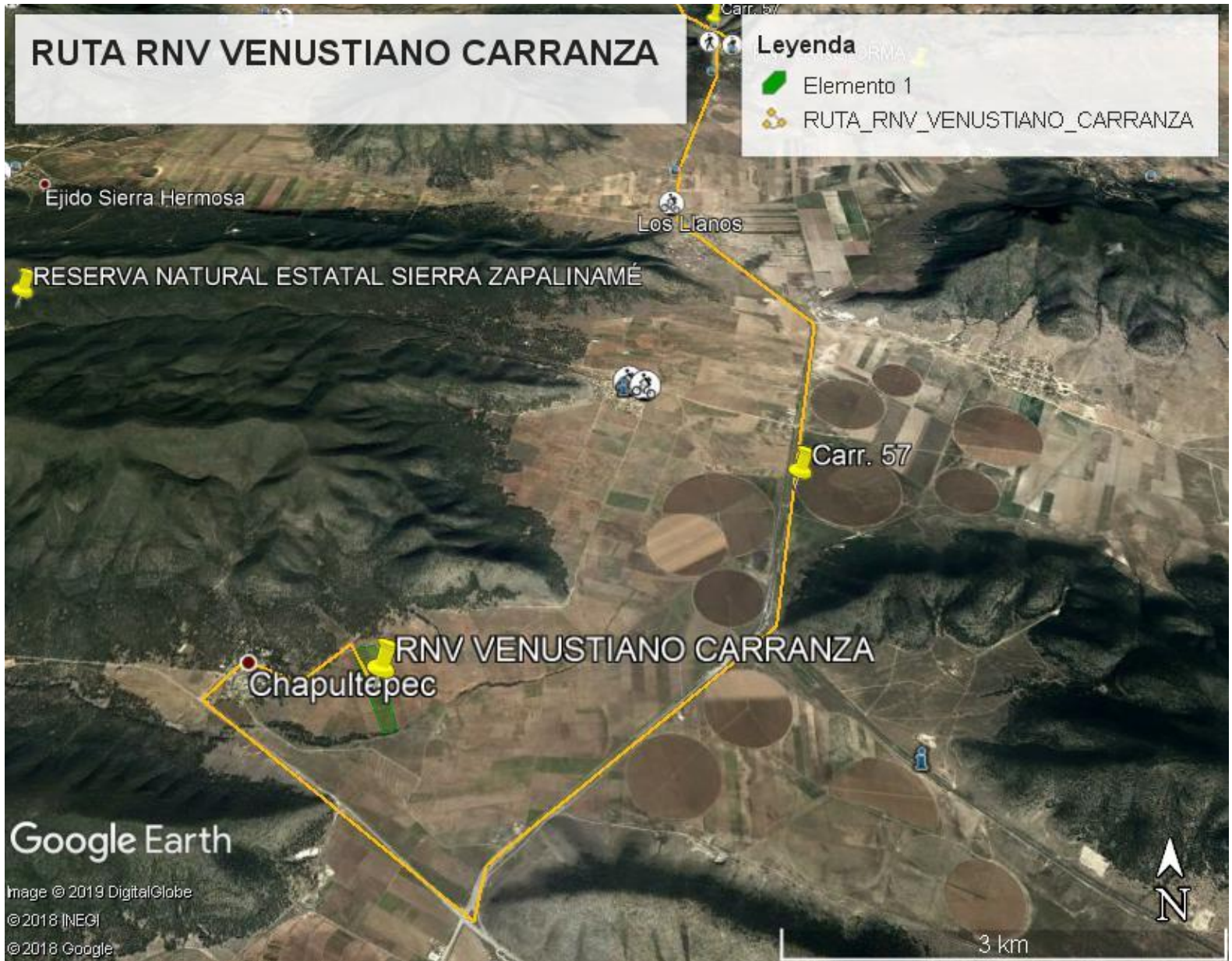
Mapa 1. Ubicación de la RNV "Venustiano Carranza" (SMA, 2019).