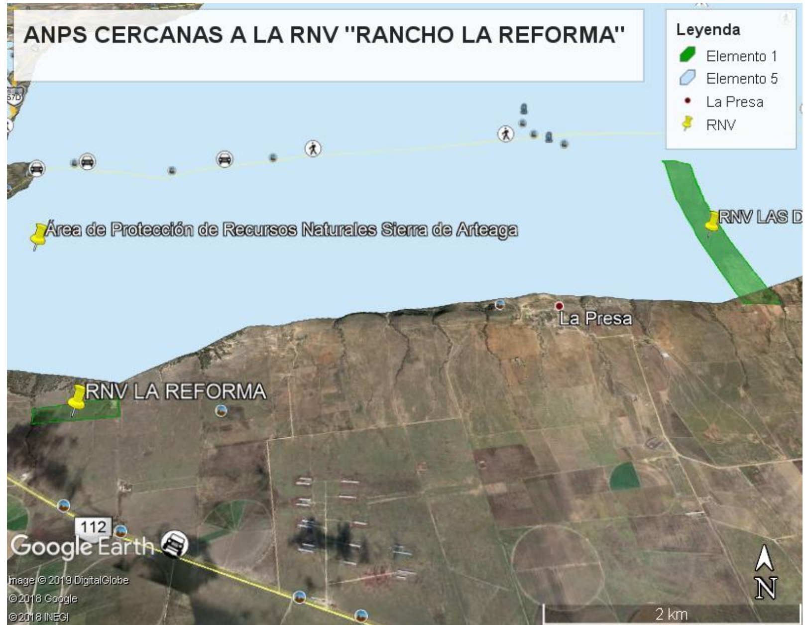
Mapa 3. Mapa de la conectividad de la RNV "Rancho La Reforma" con otras áreas naturales protegidas (SMA, 2019).