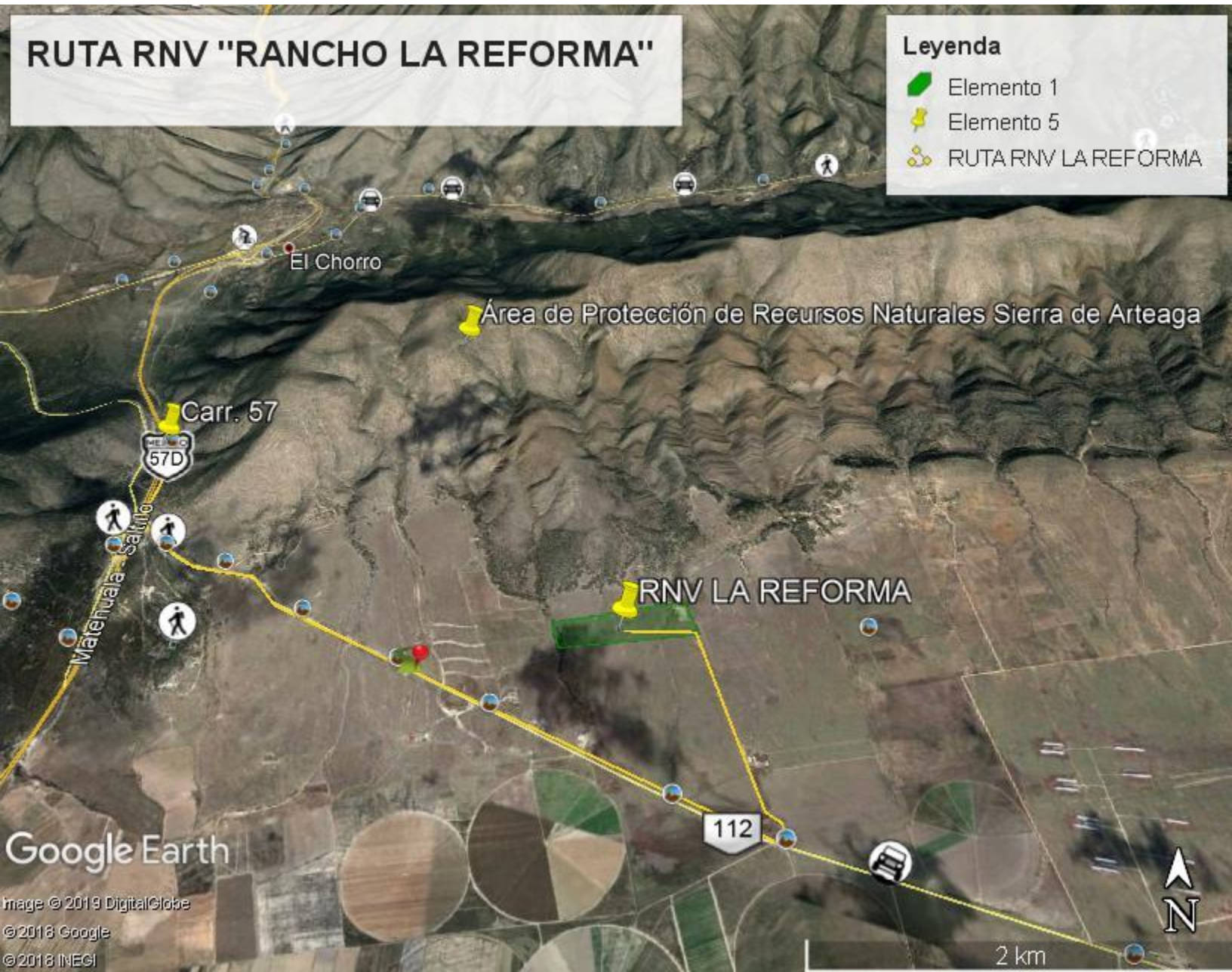
Mapa 1. Ubicación de la RNV "Rancho La Reforma" (SMA, 2019).

poniente (sin señalamiento) durante 2 kilómetros que conduce directamente a la RNV "Rancho La Reforma" (Mapa 1).