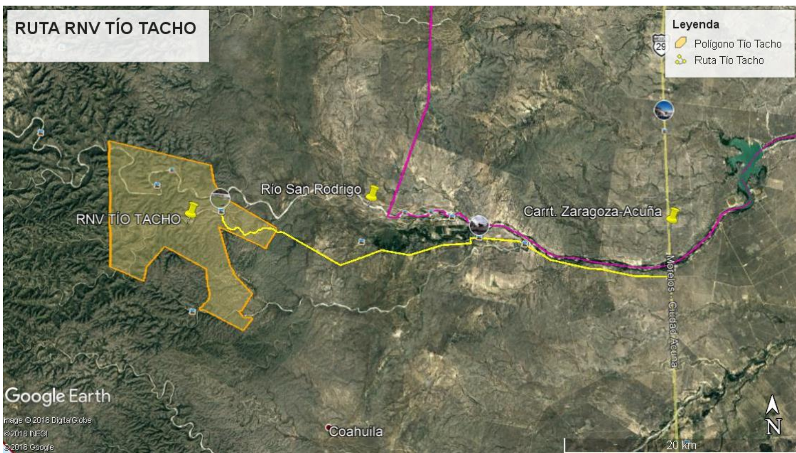
Mapa 1. Ubicación de la RNV "Rancho Ecoturístico Tío Tacho" (SMA, 2019).

Para acceder a la RNV "Rancho Ecoturístico Tío Tacho", saliendo de la cabecera municipal de Zaragoza, se toma la carretera 29 rumbo al norte hacia Cd. Acuña. A una distancia de 25 kilómetros, se encuentra una carretera pavimentado del lado izquierdo, la cual conduce al ejido El Remolino. Después del ejido se sigue una brecha de terracería hacia el sur – oeste por 40 kilómetros hasta llegar a la RNV "Rancho Ecoturístico Tío Tacho" (Mapa 1).