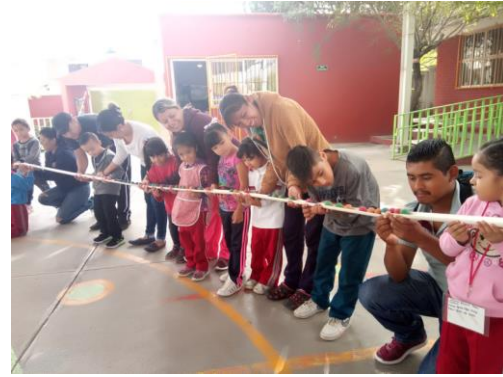
Actividad "Rodando el agua" en jardín de niños Emma Badillo Mendoza, con la participación de los padres de familia