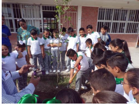
La plantación de un árbol en la escuela primaria Rubén Humberto Moreira