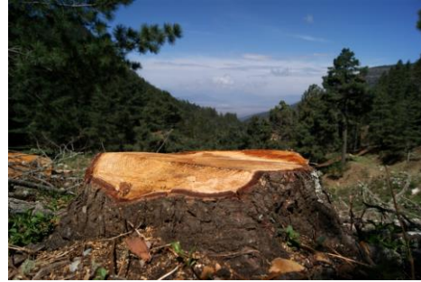
Algunas fotos ganadoras

Premio Estatal de Cuento Naturaleza y Sociedad. Este evento inició en el 2013 y ha continuado a lo largo de estos años con éxito. Contamos con el apoyo de nueve jurados externos de reconocida trayectoria en las letras y en la enseñanza para determinar a los ganadores. Estamos convencidos que la cultura no se puede desligar de los temas ambientales con la literatura, por lo que se busca fomentar la escritura centrada en recuerdos, anécdotas o imágenes que remitan a los participantes a considerar la importancia del espacio natural y social como centro de su narrativa.