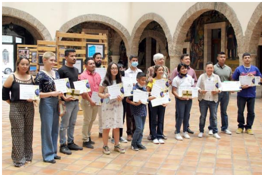
Premiación de Concursos Ambientales