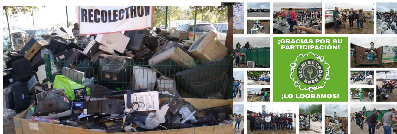
Campana de Recolectrón 2019

Por lo anterior este programa ha sido bien recibido por los municipios del estado que coordinan campañas de acopio de aparatos eléctricos y electrónicos, previas al Recolectrón a fin de sacar lo más posible del municipio.