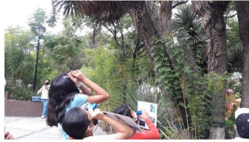
Observación de aves

También en el parque se reciben grupos escolares y docentes de los diferentes niveles educativos; personal de otros parques del estado para intercambiar puntos de vista y materiales; personal de otros municipios que incorporan el tema de cultura ambiental en sus programas de trabajo y personal de empresas para apoyar en las acciones de mejoras del parque.