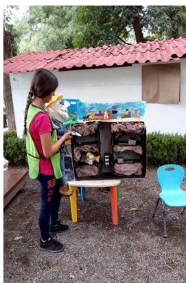
Para comprender la extracción de carbón