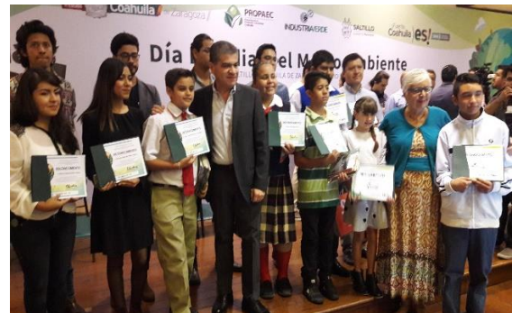
Premiación de Concursos Ambientales

Programa Oficina Verde. Es un programa que inicia en el 2013 y tiene como propósito incorporar un sistema de gestión ambiental en los espacios laborales, para promover mejores prácticas en el ahorro de recursos como el agua, la energía eléctrica, consumibles de oficina, uso responsable del parque vehicular, entre otros. En 11 años de vigencia de este programa se ha