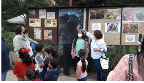
Recorrido a grupos organizados