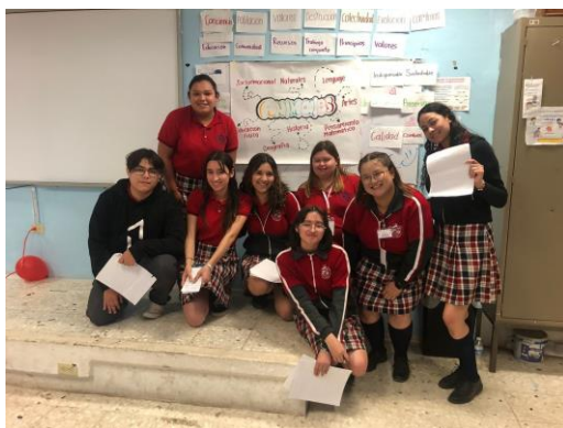
Presentación del trabajo en equipos en la Escuela Normal Experimental en San Juan de Sabinas

Educación normal y actualización docente. Con la finalidad de que los futuros docentes se apropien de temas ambientales para aplicar en su práctica docente, la Secretaría de Educación, a través de la Coordinación de Educación Normal y Actualización Docente solicitó el diseño del Curso-taller de Formación Extracurricular de Educación Ambiental en el Aula. Se diseñó un modelo flexible para acceder a las diferentes escuelas de las Normales del estado: Escuela Normal de Educación Física (ENEF), Escuela Normal Regional de Especialización (ENRE), Escuela Normal de Educación Preescolar (ENEP) y la Escuela Normal Superior del Estado (ENSE-Superior). En este proyecto se atendieron a 551 estudiantes y 37 docentes.