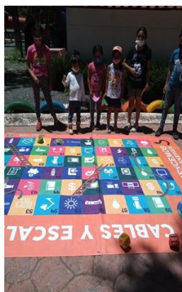
Cables y escaletas sobre los eléctricos.

A continuación, se presentan algunos ejemplos: