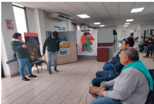
Sobre los ecosistemas de Coahuila para personal de empresa