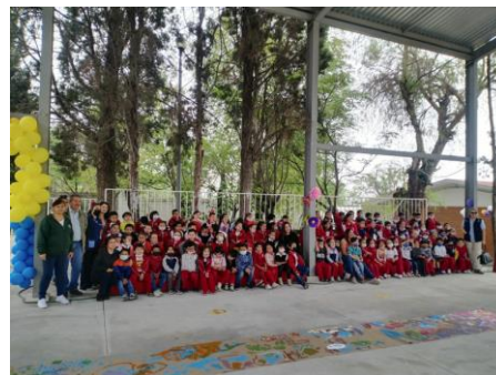
Celebrando el Día del Agua en el Jardín de Niños en el Jardín de Niños Juan Enrique Pestalozzi con la actividad "El tapete del agua"

Desarrollo de materiales didácticos en apoyo a la educación ambiental. Los materiales didácticos siempre están ubicados en el contexto de un tema. El propósito principal es promover, estimular y facilitar el aprendizaje de los sujetos, mediante los sentidos. Así como incorporar nuevos conocimientos para el aprendizaje de este mediante el uso del material.