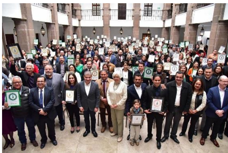
Entrega de reconocimientos a las Oficinas Verdes