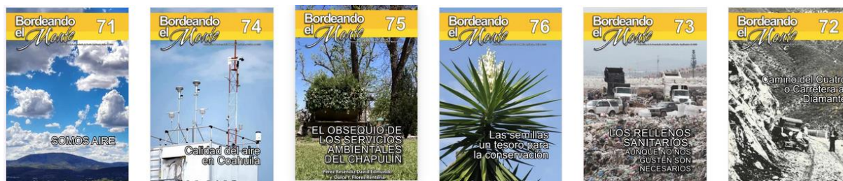
Folletos de diferentes temas socio ambientales que se han presentado a la población general de una manera clara y sencilla.

Educación normal y actualización docente. Con la finalidad de que los futuros docentes se apropien de temas ambientales para aplicar en su práctica docente, la Secretaría de Educación, a través de la Coordinación de Educación Normal y Actualización Docente solicitó el diseño del Curso-taller de Formación Extracurricular de Educación Ambiental en el Aula. Se diseñó un modelo flexible para acceder a las diferentes escuelas de las Normales del estado: Escuela Normal de Educación Física (ENEF), Escuela Normal Regional de Especialización (ENRE), Escuela Normal de Educación Preescolar (ENEP) y la Escuela Normal Superior del Estado (ENSE-Superior). En este proyecto se atendieron a 551 estudiantes y 37 docentes.