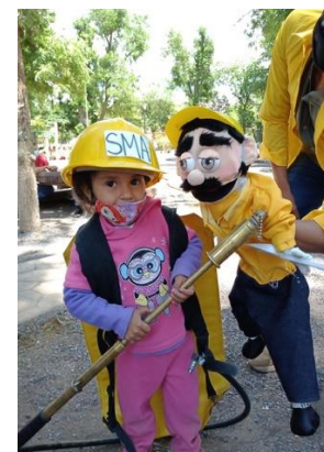
Prevención de incendios