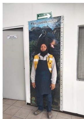
Para hablar de osos...