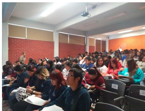
Una plenaria en el auditorio de la Universidad Pedagógica Nacional de Monclova

Programa Bien Plantados. En el 2019 se firmó un convenio con la Secretaría de Educación para impulsar un programa de reforestación en 113 escuelas del estado. Con este proyecto se buscó involucrar a las autoridades escolares, docentes, padres de familia y niños. Previamente se hicieron visitas técnicas para evaluar la pertinencia del lugar (suelo y agua) y se llevaron los árboles y las herramientas. El día de la plantación se desarrollaron las actividades: “Cada árbol por sí mismo”, “Dando y dando” y “Rodando el agua”, y se dieron charlas a los padres y maestros sobre el suelo, la importancia de los nutrientes, la ubicación del árbol, la dimensión del pozo, el agua y el cuidado posterior que se requiere para su desarrollo, así como los beneficios que aportan los árboles a la salud y el estado de ánimo de las personas.